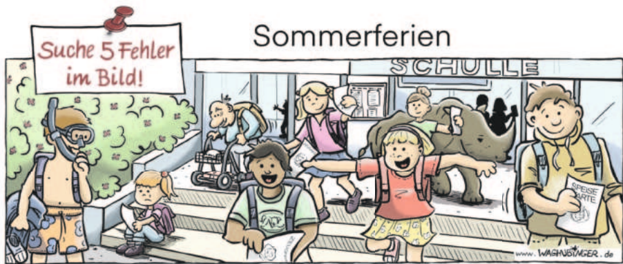
Taucher, alter Mann, Nashorn, Schulle, Schulle, Speisekarte

Bitte bei allen Terminen vorher anmelden !