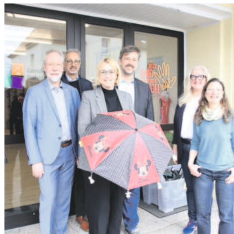
Schirmübergabe an die „Schirmherrin“