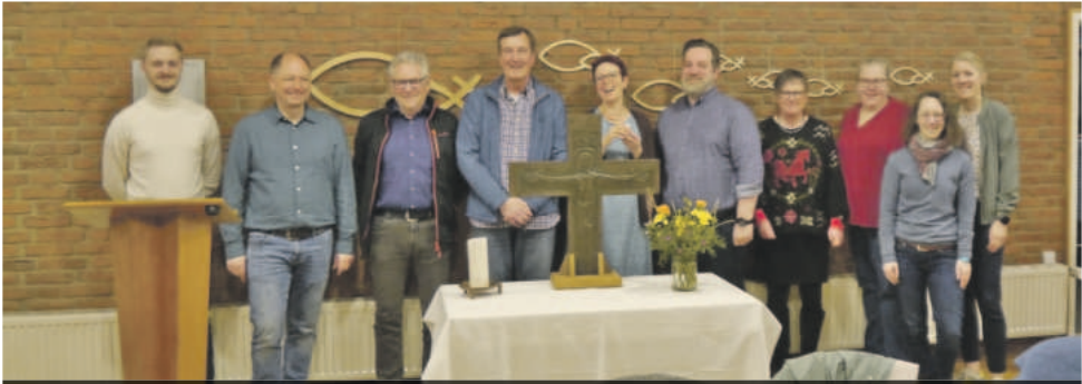
Foto vom Wahltag