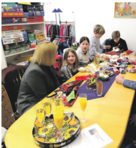
Die Eröffnung wird gefeiert.